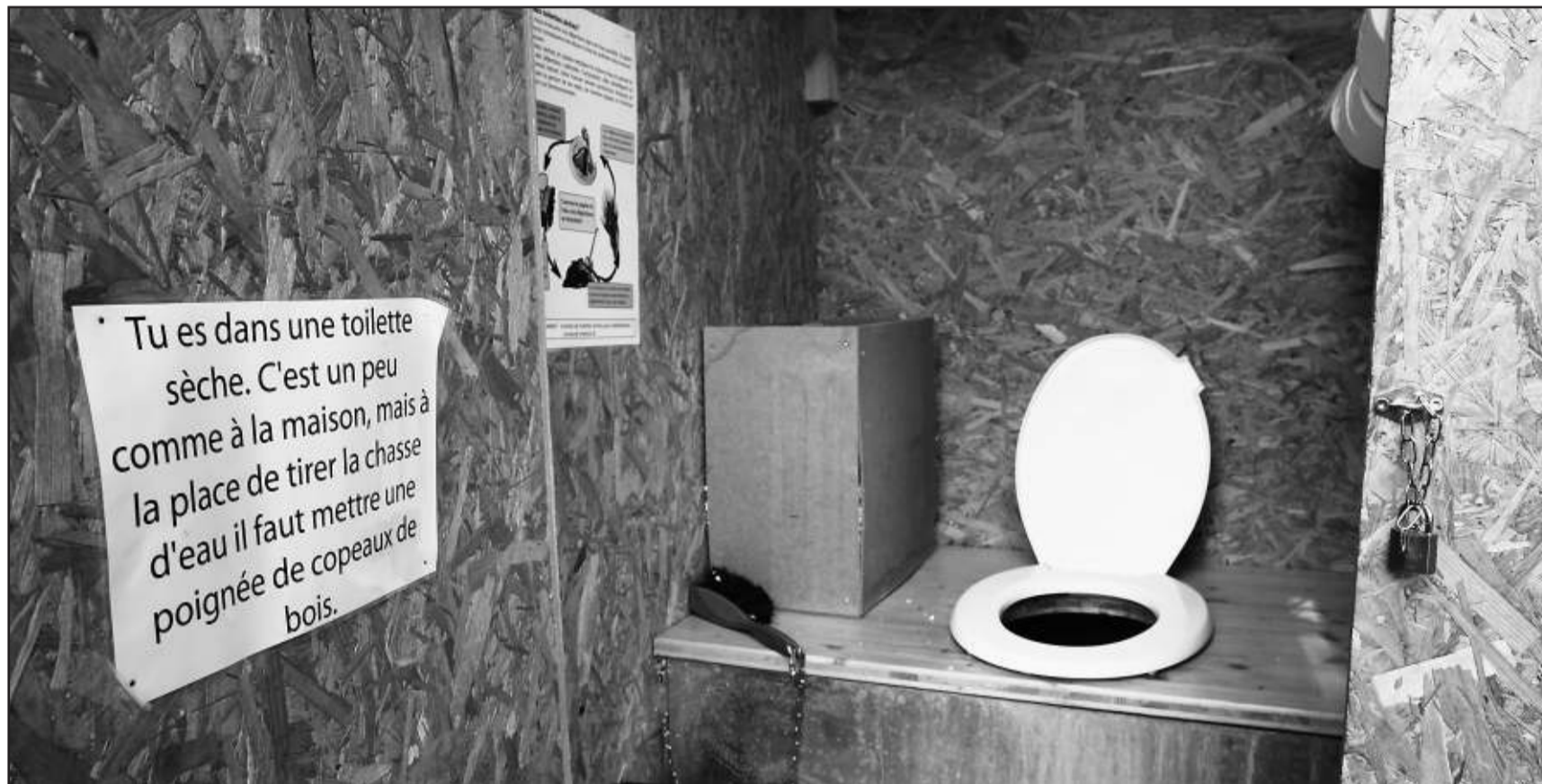
Les toilettes sèches prennent peu à peu leurs quartiers dans diverses manifestations du canton. JPDS

ENVIRONNEMENT • Les toilettes à compost permettent d'économiser près d'un tiers d'eau potable. Elles contribueraient aussi à une meilleure gestion des eaux usées.