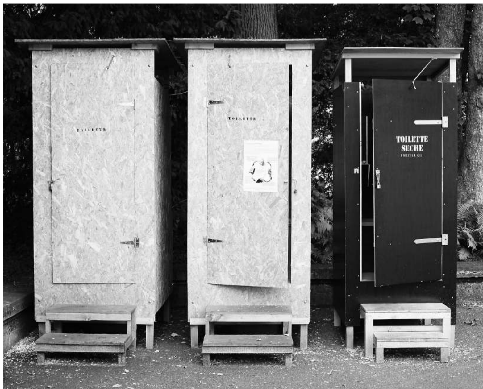
Ce type de WC permettant d'économiser l'eau potable remporte un succès croissant. A Cressy, un immeuble pilote en sera prochainement équipé. JPDS