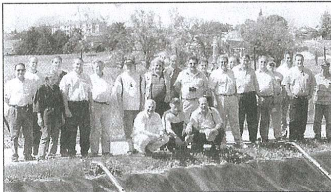
La délégation suisse qui s'intéresse particulièrement au traitement des boues sur lits plantés de roseaux

Le réseau d'alimentation permet d'amener les boues jusqu'en surface des filtres. Les boues sont prélevées directement à partir du bassin de boues activées après une phase d'aération. La station est équipée de huit cellules de filtration alimentées en alternance par l'intermédiaire d'une rampe d'alimentation par cellule. Chaque rampe comprend 5 points d'injection et est équipée d'une vanne de sectionnement.